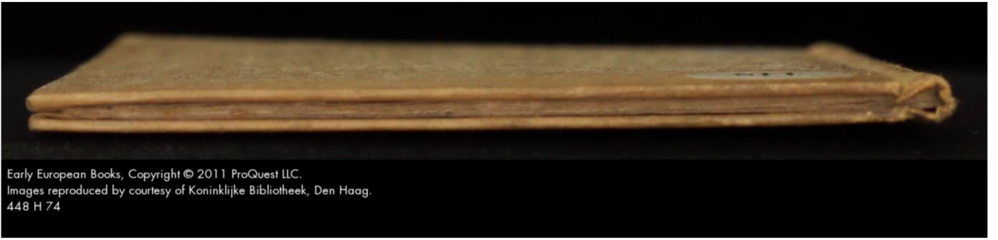
448 H 74